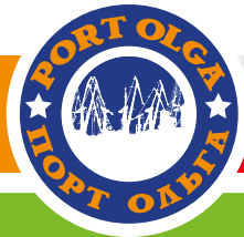
Scheme the seaport Olga